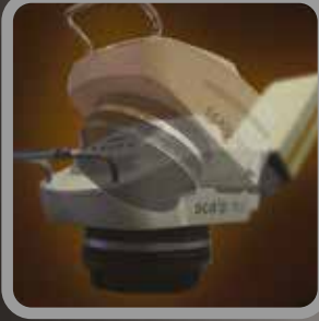
Saç Bakım Ünitesi