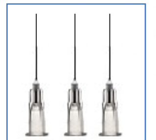
3 ÖZEL UÇ